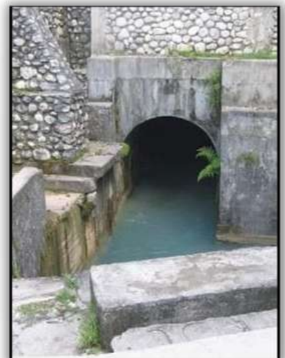
Images du Canal d'Avezac de Camp-Perrin