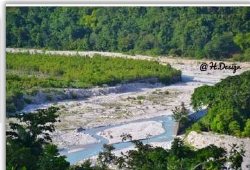
Ravine du Sud