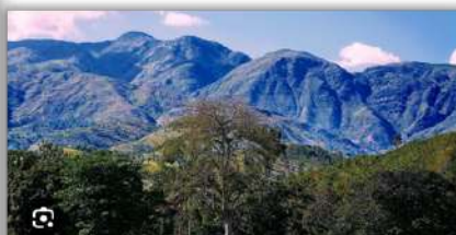
Vue panoramique de Camp-Perrin