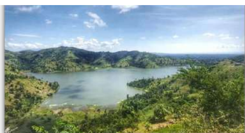
Étang Lacho