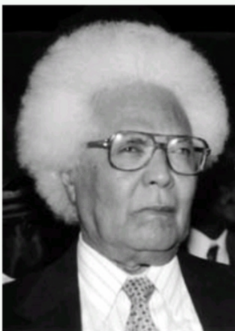
L'écrivain Félix Morisseau-Leroy.